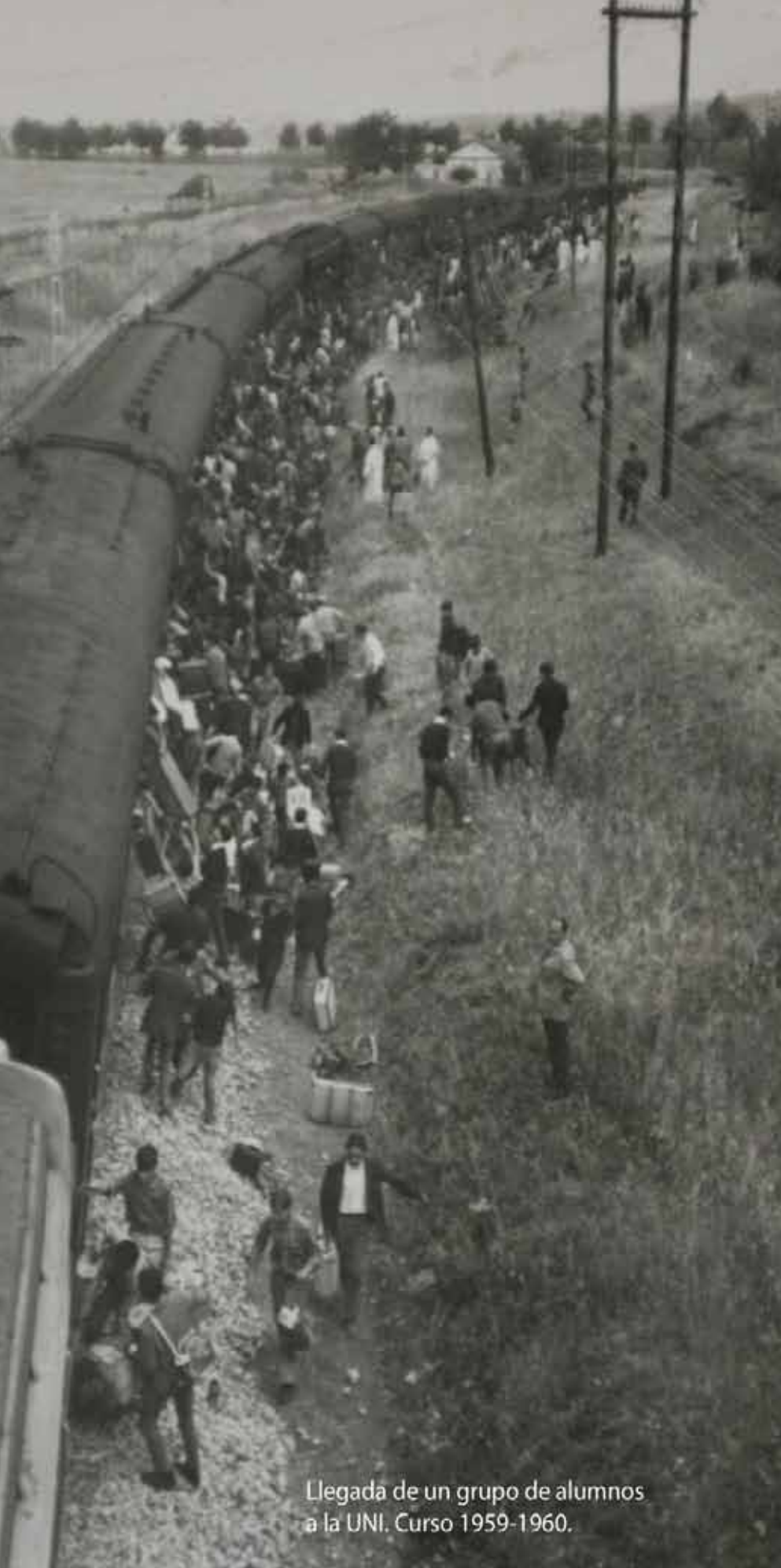
Llegada de un grupo de alumnos a la UNI. Curso 1959-1960.